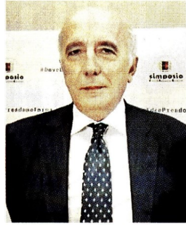
Gigi Proietti, scomparso il 2 novembre del 2020. Sopra, il presidente di Fondazione Roma Franco Parasassi

ARTICOLO NON CEDIBILE AD ALTRI AD USO ESCLUSIVO DEL CLIENTE CHE LO RICEVE - DS3423 - S.15809 - L.1626 - T.1626