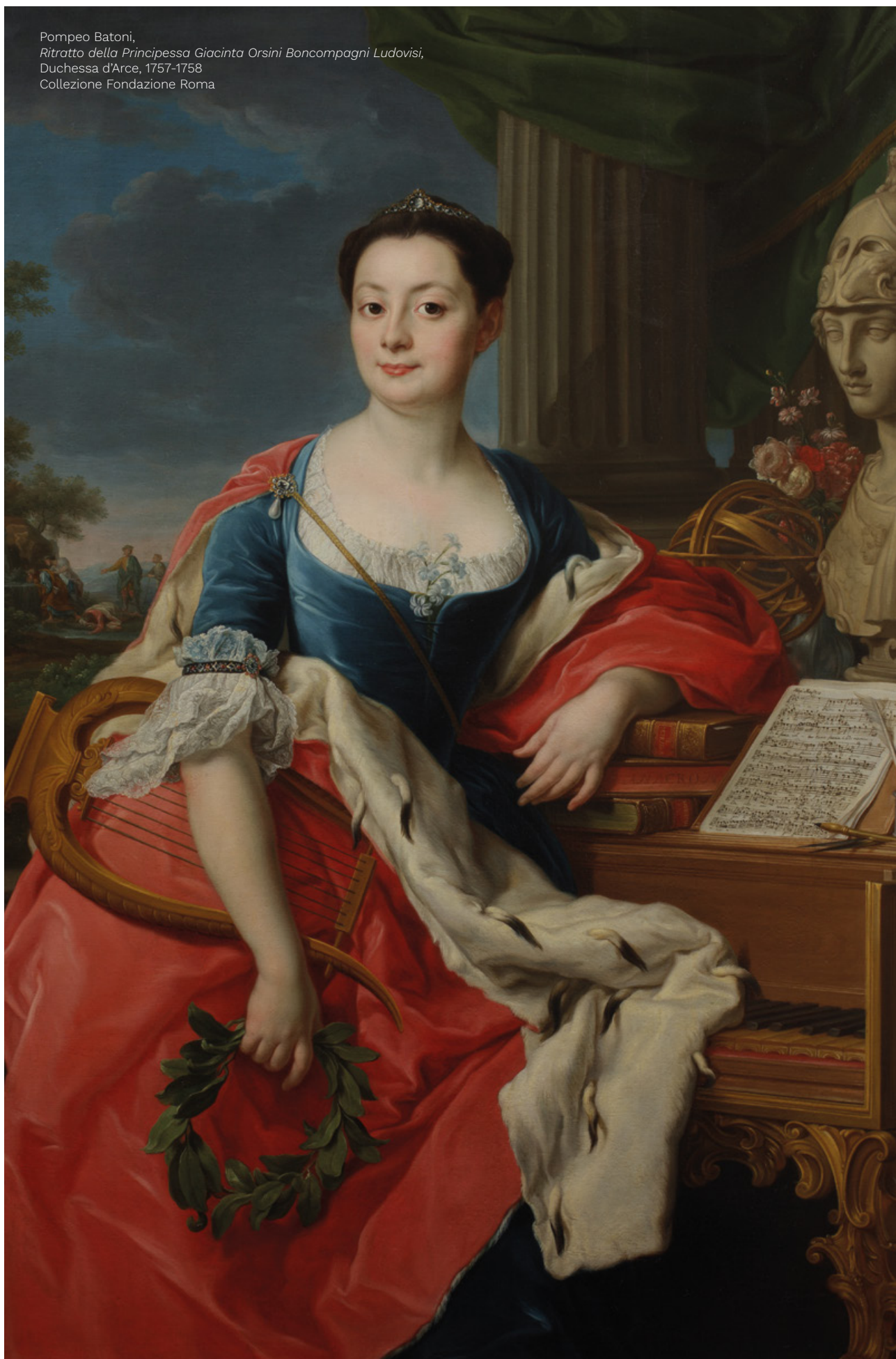
Pompeo Batoni, Ritratto della Principessa Giacinta Orsini Boncompagni Ludovisi, Duchessa d'Arce, 1757-1758