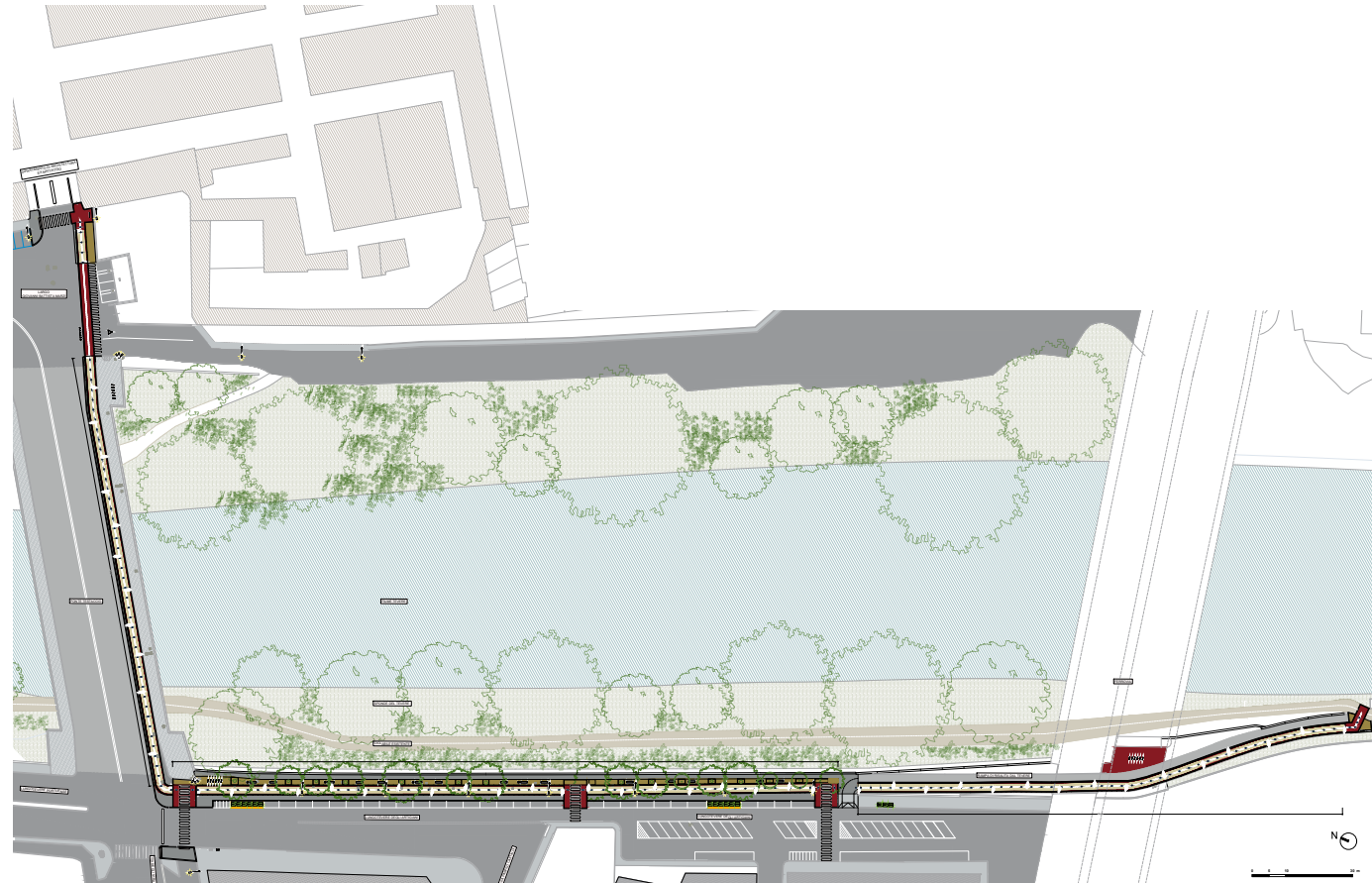
Planimetria generale >