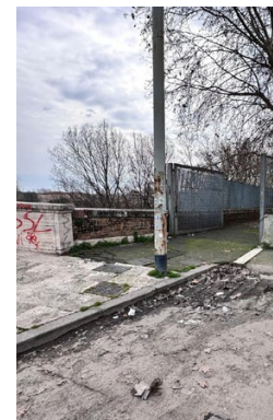
Ponte Testaccio: incrocio via Stradivari