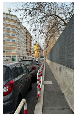
Lungotevere: area ex Mercato