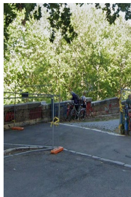
Rampa Tevere: degrado marciapiede