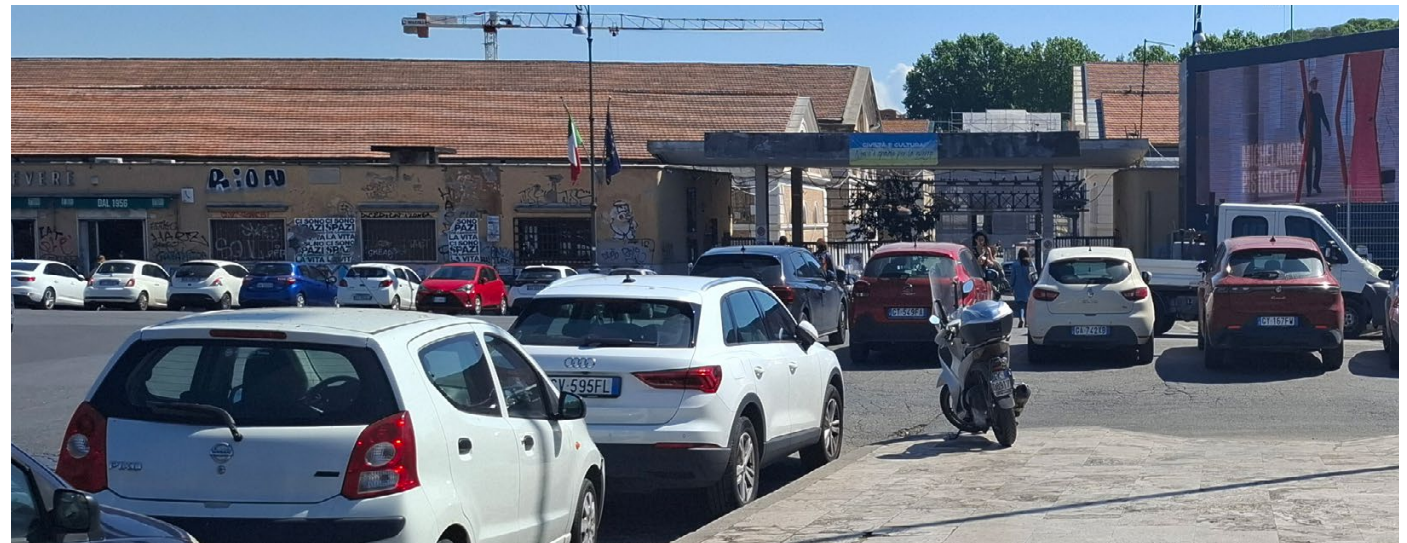
Largo G. B. Marzi - Mattatoio >